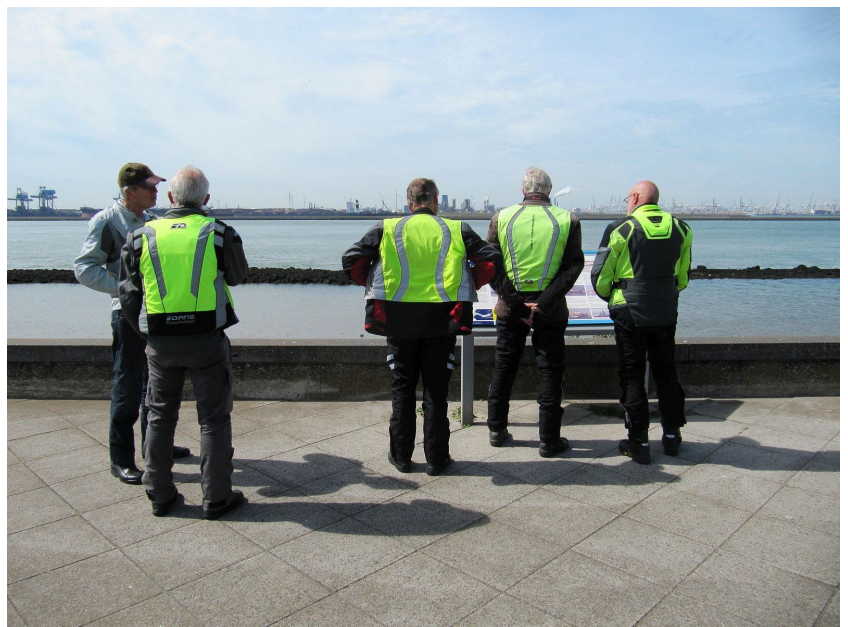
De benen strekken aan oever van de Nieuwe Waterweg

Het ochtend traject begon door het Westland, in zuidelijke richting, tussen veelal glazen bebouwing door. Nog even leken we het erf van een boer op te rijden, maar het bleek hier toch om een openbare weg te gaan. De bedrijvigheid in dit gebied is overigens enorm en iemand maakte dan ook de opmerking "hier wordt geld verdient". Het Westland heeft niet altijd de mooiste motorweggetjes, maar indrukwekkend was het wel en velen hadden dit gebied nog nooit doorkruist.