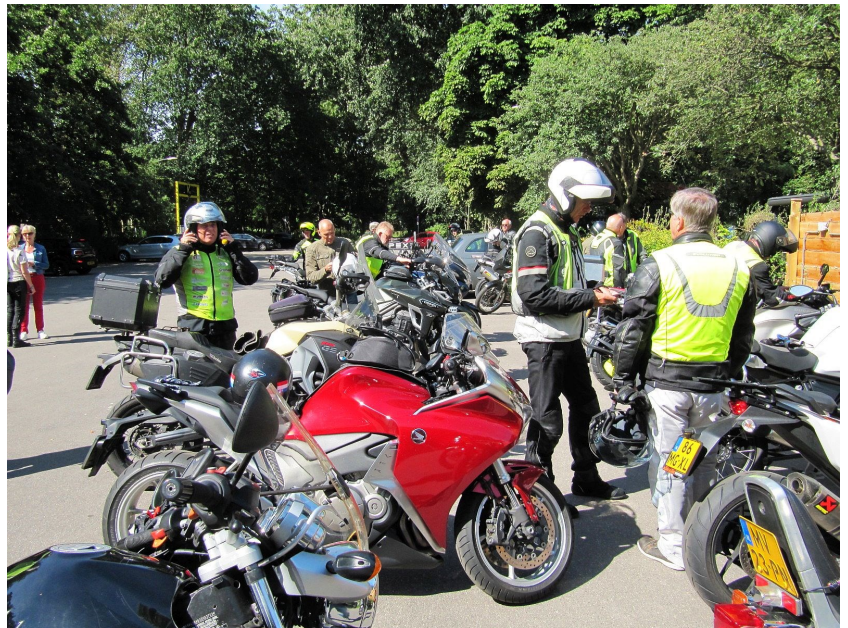
Vertrek bij PEX restaurant in Den Haag

We verzamelen om 10:00 uur bij PEX restaurant in Den Haag, het startpunt van deze rit. Dit restaurant was bij Peter om de hoek en dat had hij goed geregeld. "Zo, dan hoef ik een keer niet ver te rijden", zo liet hij weten.